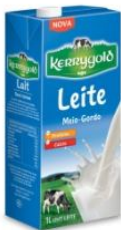
सप्रेटा (मलाई रहित) दूध